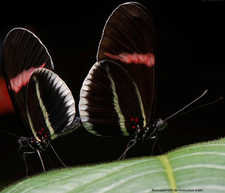
Accouplement de Heliconius erato

Comme chez l'Homme, le choix du partenaire est l'une des décisions les plus importantes de la vie d'un papillon. Est-ce une bonne rencontre ? Prendront-ils soin de leur progéniture ? Et le plus important, sont-ils de la bonne espèce ? Les papillons prennent ces décisions sur la bases de différents facteurs : à quoi ressemble-t-il ? quelle est son odeur ? Est-il du même endroit ? Le processus complexe du choix d'un partenaire a entraîné l'apparition de certains traits et comportements parmi les plus étonnants du monde sauvage.