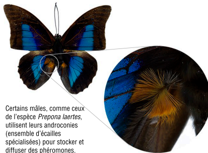
Certains mâles, comme ceux de l'espèce Prepona laertes , utilisent leurs androconies (ensemble d'écaillles spécialisées) pour stocker et diffuser des phéromones.