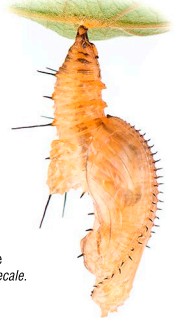
Chrysalide de Heliconius hecale .

Puisque les femelles non fécondées sont souvent rares, les mâles doivent souvent rivaliser pour s'accoupler. Cette compétition pour trouver un partenaire sexuel est parfois très forte. Chez certaines espèces d' Heliconius , les mâles vont jusqu'à s'accoupler avec les femelles à l'instant où elles émergent de leur enveloppe nymphale.