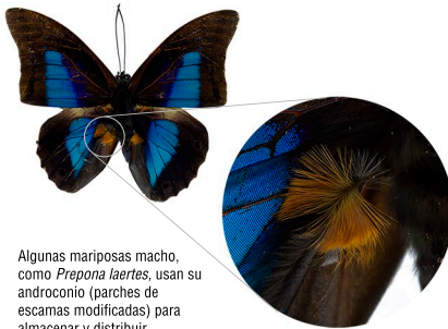
Algunas mariposas macho, como Prepona laertes , usan su androconio (parches de escamas modificadas) para almacenar y distribuir feromonas.

Esencias atrayentes. Mariposas y polillas frecuentemente usan perfumes especializados, llamados feromonas, para reconocer potenciales parejas. En las polillas, el olor de estos perfumes puede atraer hembras a cientos de metros de distancia. Además de usar la visión, muchas mariposas usan también el olfato para encontrar pareja, aunque normalmente a distancias mucho más cortas.