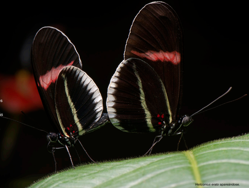
Heliconius erato apareándose.

Al igual que los humanos, para las mariposas el encontrar pareja es una de las decisiones más importantes de la vida. ¿Es un buen partido? ¿Proveerá suficientes recursos a los descendientes? Y más importante, ¿Es la especie correcta!? Las mariposas basan sus decisiones en varios factores: ¿Cómo se mira? ¿Cómo huele? ¿Es de mi vecindario? El complicado proceso de encontrar pareja ha conducido a la evolución de algunas de las características y comportamientos más asombrosos del mundo natural.