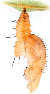
Pupa de Heliconius hecale .

Cópula pupal. Ya que las hembras vírgenes suelen ser difíciles de hallar, los machos frecuentemente deben competir para aparearse. Esta competencia por parejas suele ser fuerte. En algunas especies de Heliconius , ¡los machos incluso se aparean con hembras mientras estas están emergiendo de la pupa!