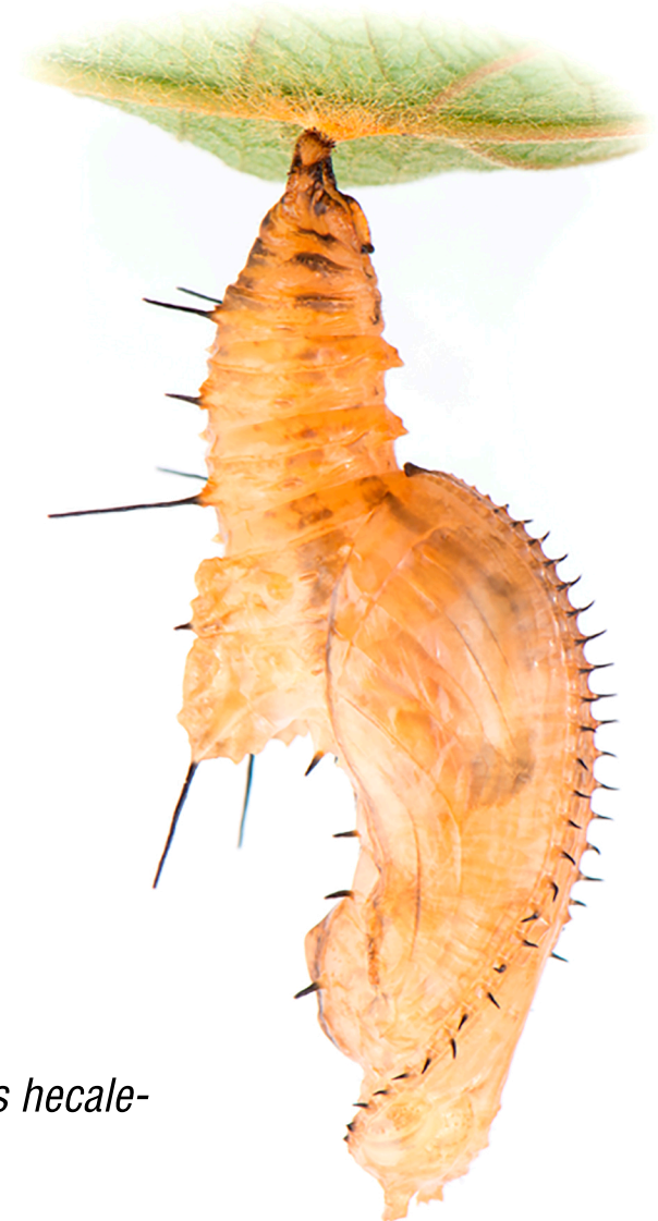
Heliconius hecale -Puppe.

Da unbefruchtete Weibchen oft sehr selten sind, müssen Männchen häufig miteinander wetteifern, wer sich fortzupflanzen kann. Dieser Konkurrenzkampf kann sehr intensiv sein. In manchen Heliconius -Arten begatten Männchen das Weibchen gar, wenn es aus der Puppe schlüpft.