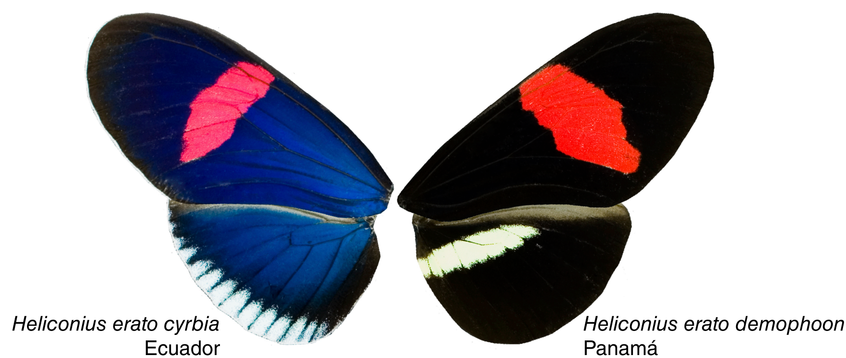
Heliconius erato cyrbia Ecuador

Colores estructurales. Estructuras ordenadas, como capas o enrejados, de tamaños similares a la longitud de onda del espectro de luz, pueden causar la reflexión de una determinada longitud, produciendo un color único. El resto de longitudes de onda son absorbidos por pigmentos ubicados bajo tal estructura.