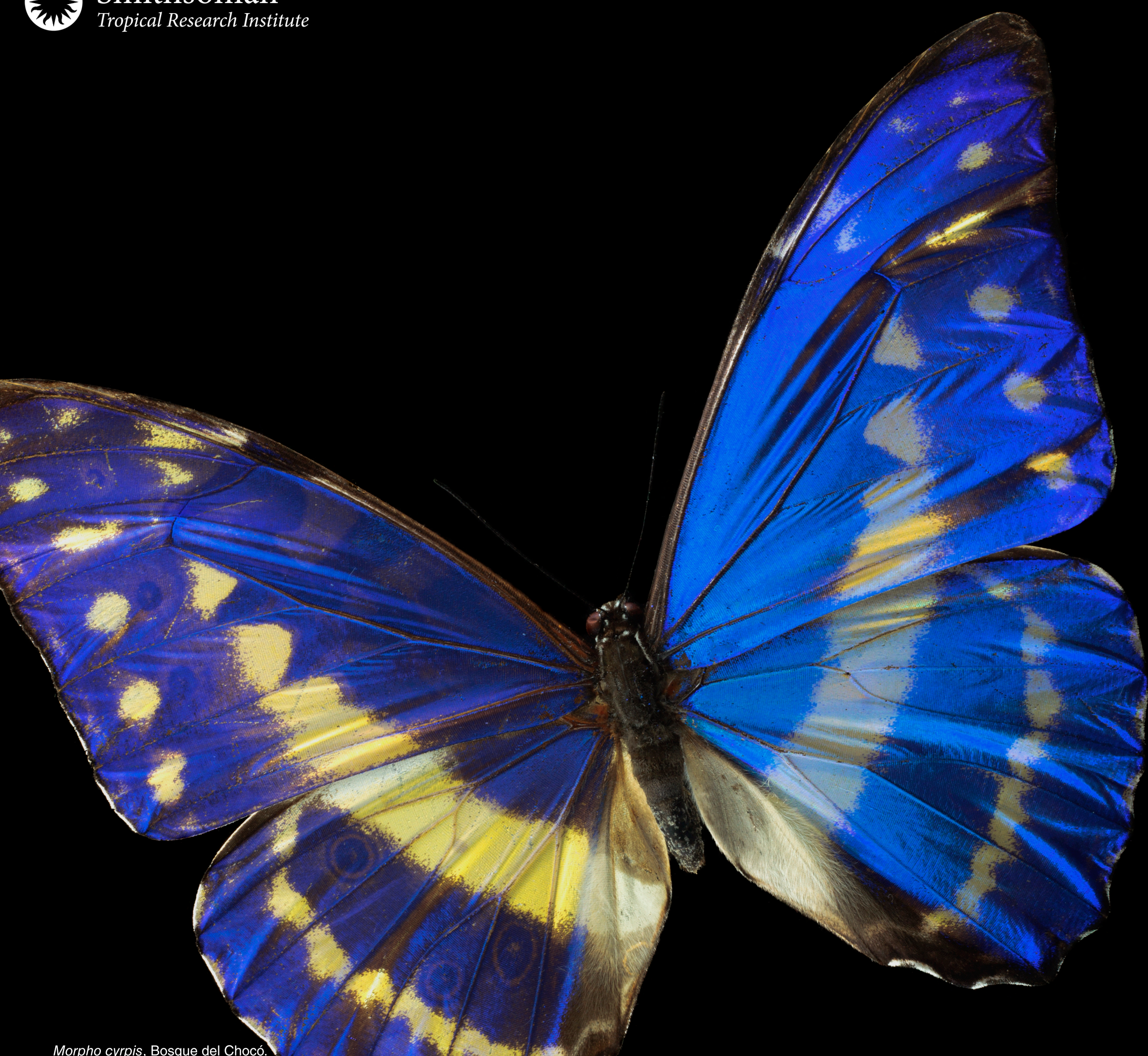
Morpho cypris , Bosque del Chocó.