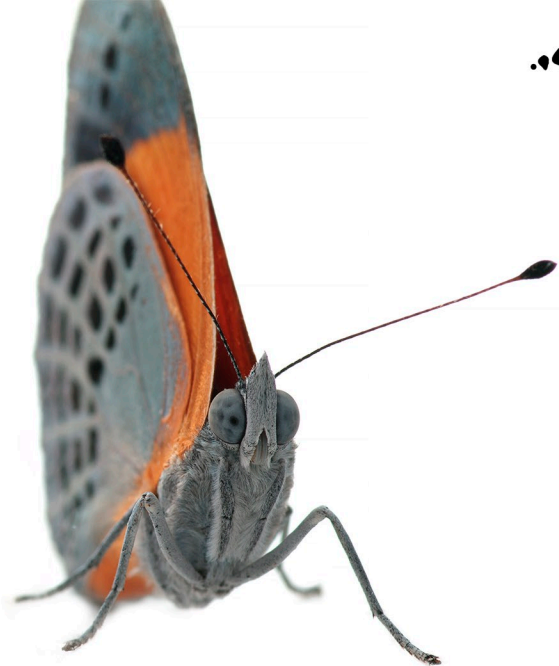
Asterops marlii , amazone équatorienne

Les yeux ont pour fonction de capter les informations concernant l'intensité et la distribution de la lumière. Comme la plupart des insectes, les papillons ont des yeux composés, qui sont eux mêmes constitués de milliers de petits yeux hexagonaux. L'évolution leur a permis d'acquérir des compétences remarquables, telles qu'un champ de vision plus large et une meilleure perception des mouvements rapides. Leurs yeux sont également capables de percevoir la lumière ultraviolette et polarisée. Ces adaptations visuelles permettent de détecter et reconnaître de manière fiable les différentes sources de nourriture, les plantes hôtes et les partenaires sexuels. Les papillons Heliconius sont un bon exemple d'espèces pour lesquelles l'importance de l'information visuelle relatif à la réponse comportementale est bien comprise.